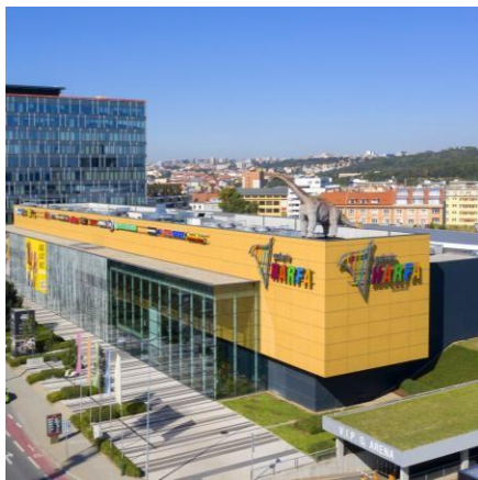
Galerie Harfa Praha