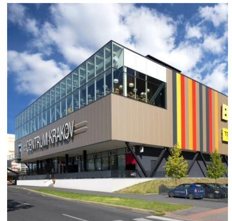
Centrum Krakov Praha