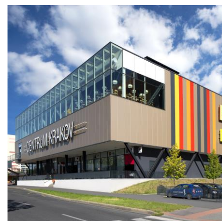
Centrum Krakov Praha