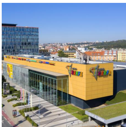
Galerie Harfa Praha